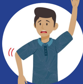
A rm Weakness 手臂無力