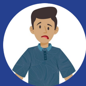
F ace Drooping 面部下垂