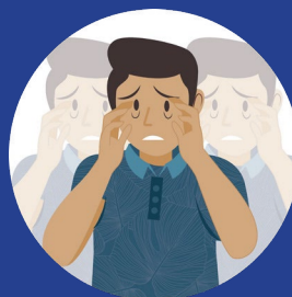
E yesight Problems 視力問題