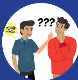
S peech Difficulty 言語困難