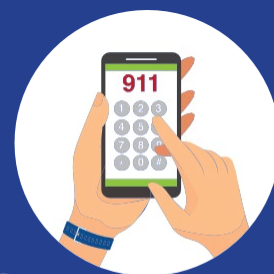
T ime to call 9-1-1 請即刻撥打 9-1-1