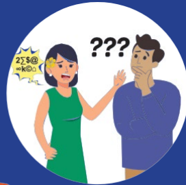
S peech Difficulty 어눌한 말투