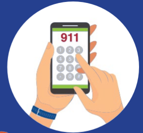
T ime to call 9-1-1 9-1-1 전화